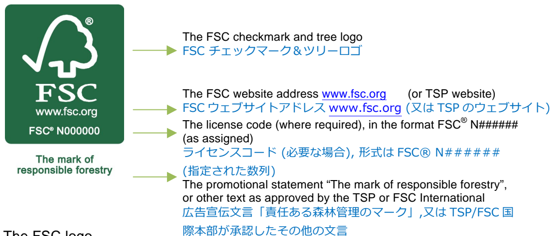
Figure 2: The FSC logo