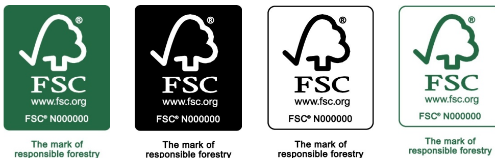
Figure 6: Standard colors of the FSC logo