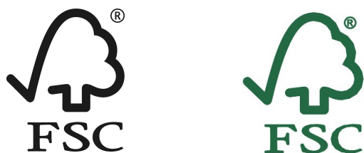
図 6: FSC ロゴの基本色