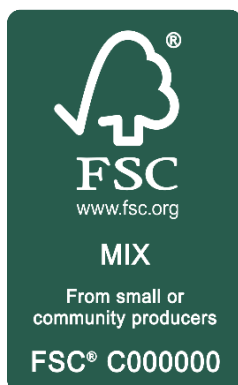
Figure 1 FSC 100% and FSC Mix from small enterprises already included in FSC-STD-50-001 (wordings may change)